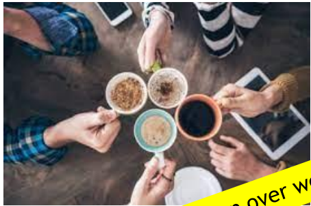
Praten over werk

"De beste manier om iets te leren is er les in te geven."