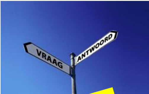
Geen antwoord geven